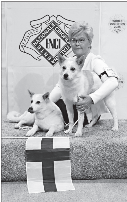
Joutsenvaaran Safran oli veteraanivoittaja MVV 20 (vasemmalla kuvassa) ja Joutsenvaaran Forest Fantasy MV 2020.

Oma sekoilunsa oli vielä tuo DNA-testipakko, jos halusi koiralleen Espanjanvalion arvon vahvistettavaksi. Tästä ilmoitettiin näyttelyn sivuilla vasta