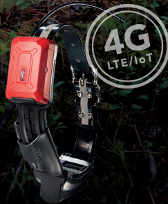
Ultracom R10i Hybrid